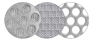
optional filter inserts: mesh size 0.05 ... 10 mm

Wire mesh: Stainless steel internally, Mesh size 1,0 mm